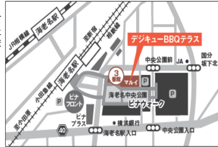
F243-0483 神奈川県海老名市中央1-6-1 ピナウォーク 3番館 屋上(7F)