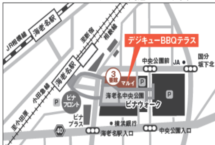
〒243-0483 神奈川県海老名市中央1-6-1 ピナウォーク 3番館 屋上(7F)

コロナの影響でしばらく県央ブロックでも皆さんが集まっていたイベントを自粛してきましたが、この度、計画を立ててみました。