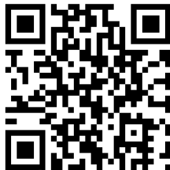
支部HP カット講習 QR コード